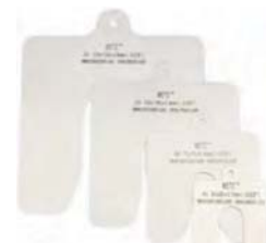
Calços calibrados avulsos (min de 20 peças)