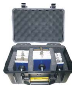
Maleta de calços INFRARED