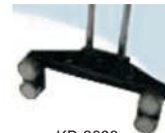
KB-8003 Suporte furo passante